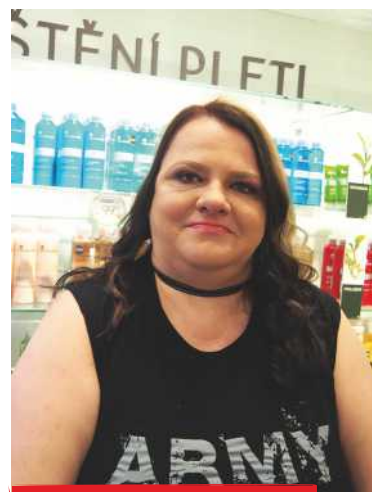
...po nalíčení v Yves Rocher.