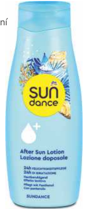
dm SUNDANCE emulze po opalování 500 ml 49,90 Kč