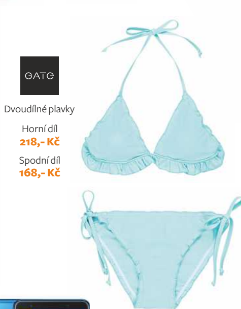
GATG Dvoudílné plavky Horní díl 218,- Kč Spodní díl 168,- Kč