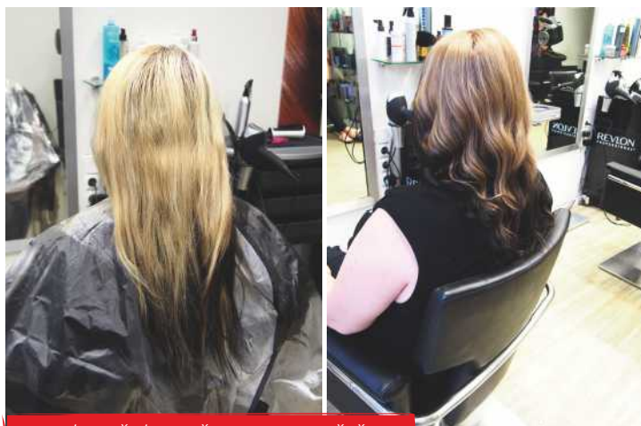
...vlasy před proměnou a po proměně.