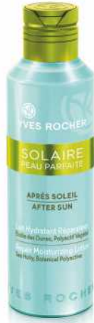
YVES ROCHER FRANCE Hydratační mléko po opalování 150 ml 279,- Kč