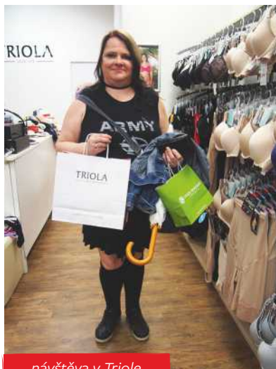
...návštěva v Triole.

kruhy pod očima. Nakonec bylo celé líčení pleti zafixováno pudrem a obličej byl zvýrazněn tvářenkou. Oči nalíčila vizážistka v hnědofialových odstínech a celé líčení očí zakončila černou regenerační řasenkou pro objem řas. Následovalo ještě domalování obočí. Rty byly nalíčeny fialovou rtěnkou a leskem pro optické zvětšení objemu rtů.