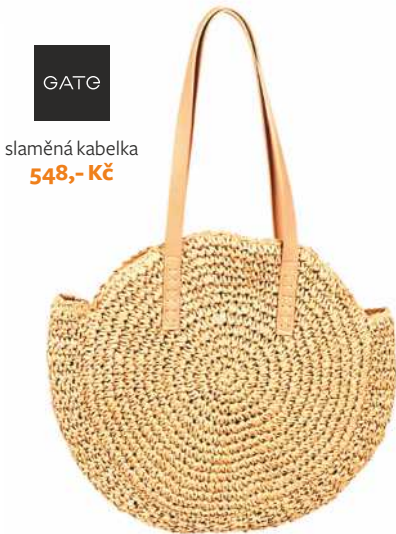
GATG slaměná kabelka 548,- Kč